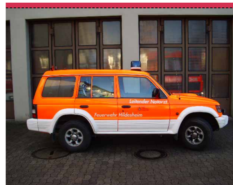
ELW LEITENDER NOTARZT