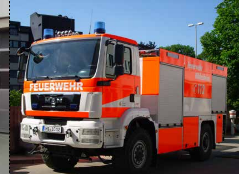
TLF 20/40 SL