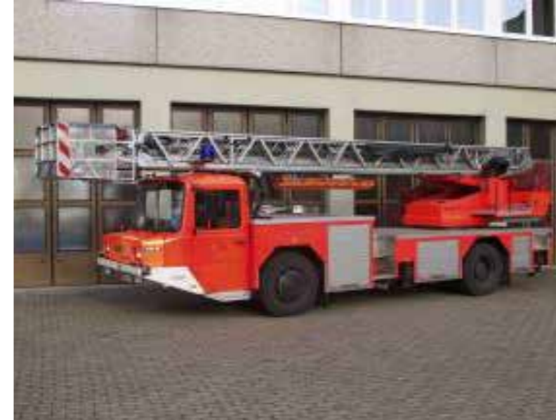
DLK 23-12 N.B. CC