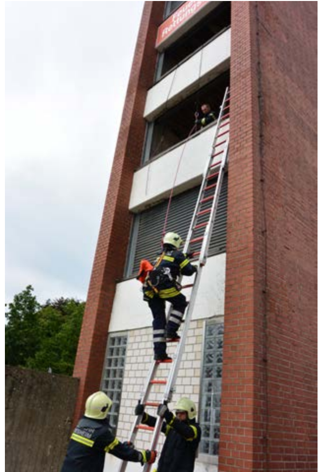
Foto oben: Gut gesichert durch die Ausbilder im Schlauchturm geht es über die Steckleiter nach oben.

Dass die Ausbildungskooperation eine echte Erfolgsgeschichte ist, zeigt ein Blick auf die Zahlen: Seit 1992 wurden 587 Feuerwehrleute aus