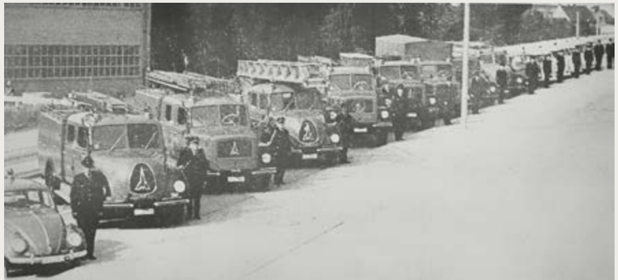
1964 wird die heutige Wache der Berufsfeuerwehr am Kennedydamm eingeweiht. Zu diesem Anlass werden Fuhrpark und Mannschaft vor der Wache in Szene gesetzt.

Am 23. Mai 1991 wird die Berufsfeuerwehr gemeinsam mit den Freiwilligen Feuerwehren Stadtmitte 1 und 2 zu einem Dachstuhlbrand in der Steuerwalder Straße alarmiert. Gelöscht wird über zwei Drehleitern und ein Tanklöschfahrzeug.