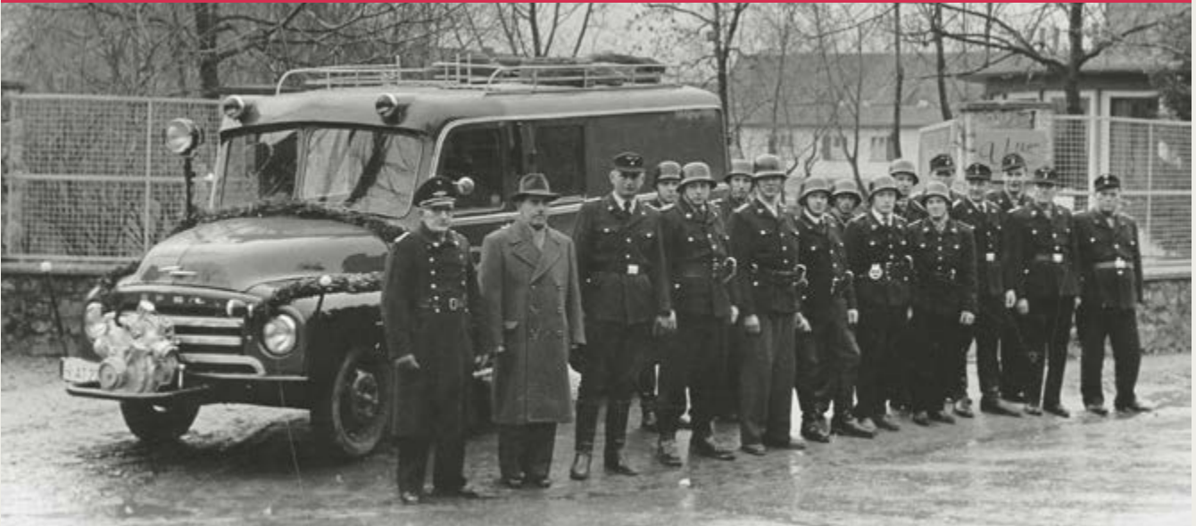
Ein Blitz für Himmelsthür. Von der Gemeinde Güldener Winkel erhält die Freiwillige Feuerwehr 1957 dieses Löschgruppenfahrzeug mit Tragkraftspritze und Vorbaupumpe, aufgebaut auf einem Opel Blitz.